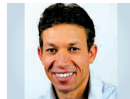
Nome: Kero Kero